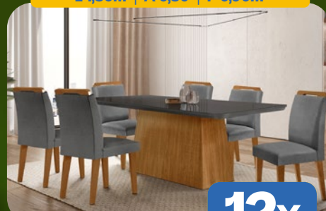
SALA DE JANTAR COM 6 CADEIRAS