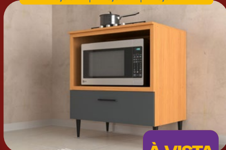
BALCÃO FORNO 80CM