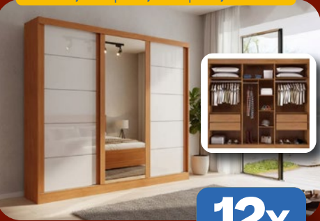
ROUPEIRO 100% MDF C/ ESPELHO