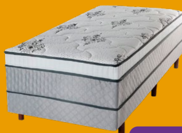
BOX SOLTEIRO CONJUGADO ESPUMA