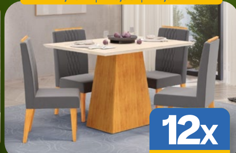
SALA DE JANTAR 120CM C/ 4 CADEIRAS