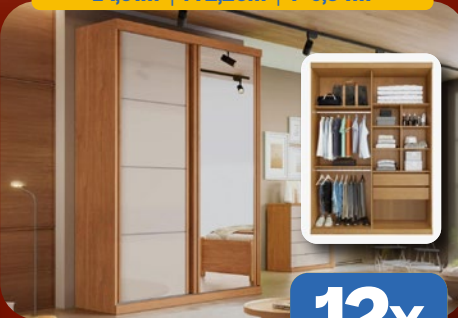
ROUPEIRO 100% MDF C/ ESPELHO