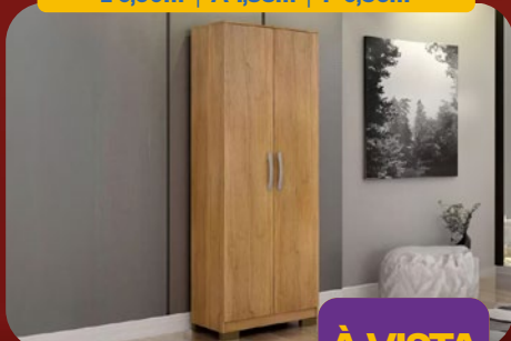
ARMÁRIO MULTIUSO 60CM