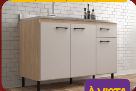
BALCÃO PIA 120CM