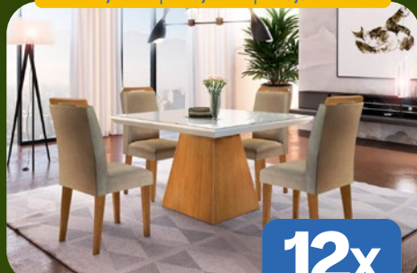
SALA DE JANTAR COM 4 CADEIRAS