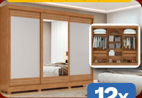
ROUPEIRO C/ ESPELHO 270CM