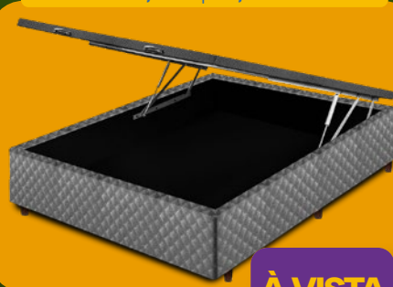
BOX BAÚ CASAL 138CM