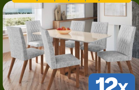
SALA DE JANTAR COM 6 CADEIRAS