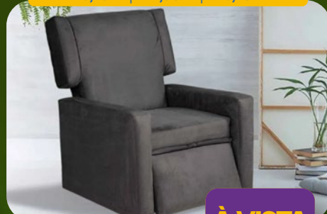
POLTRONA DO PAPAI RECLINÁVEL