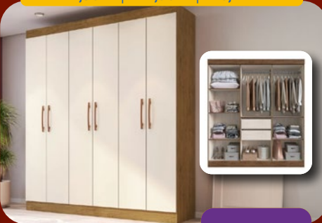
ROUPEIRO 100% MDF 180CM