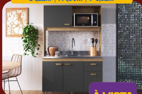
COZINHA COMPACTA 122CM