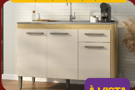
BALCÃO PIA 120CM