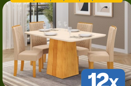
SALA DE JANTAR COM 4 CADEIRAS