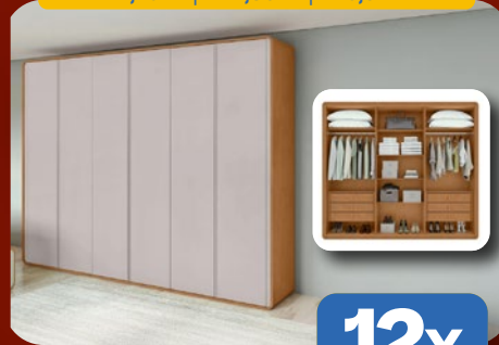
ROUPEIRO CASAL 100% MDF 270CM