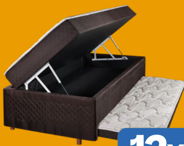
BOX CONJUGADO MOLAS ENSACADAS