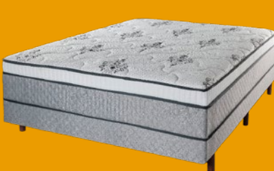
BOX CASAL CONJUGADO ESPUMA