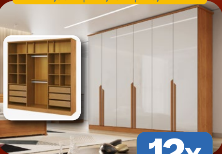
ROUPEIRO CASAL 100% MDF 230CM