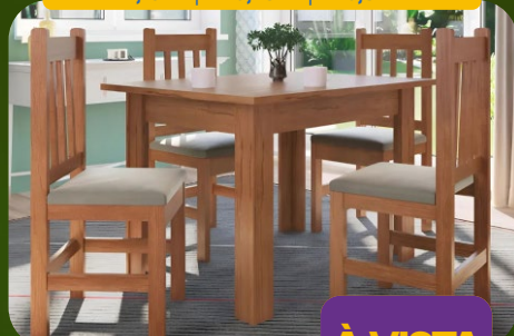
MESA COM 4 CADEIRAS 115CM