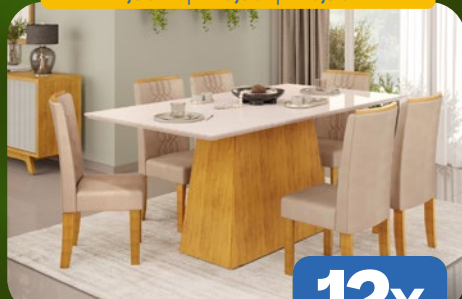
SALA DE JANTAR 180CM C/ 6 CADEIRAS